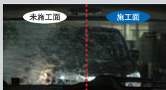
夜間のリアガラス

※日刊自動車新聞用品大賞2009「ケミカル部門賞」受賞。 比較画像は全て、水道水をホースで散水し、人工的に雨をイメージさせたものです。