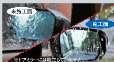
サイドガラスを通して見たドアミラー