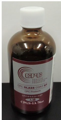
【変更前:白キャップ】