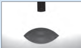
※未施工ガラス面の水接触角