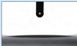
※施工済ガラス面の水接触角