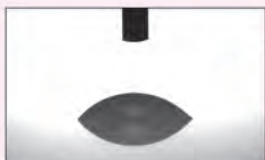
※未施工ガラス面の水接触角