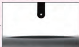
※施工済ガラス面の水接触角